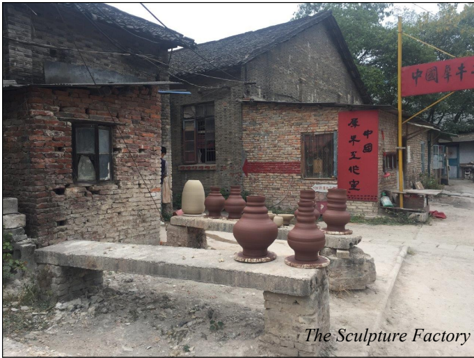
The Sculpture Factory

det hele taget et meget ungt og dynamisk miljø. Her blev produceret både støbte og drejede emner og selvom brugsting dominerede, fandtes der også mere eksperimenterede arbejder. Den store produktion af keramik overalt i byen betød også, at der er hele gader med råvarer og værktøj - et slaraffenland for keramikere - og der blev indkøbt en ekstra kuffert.