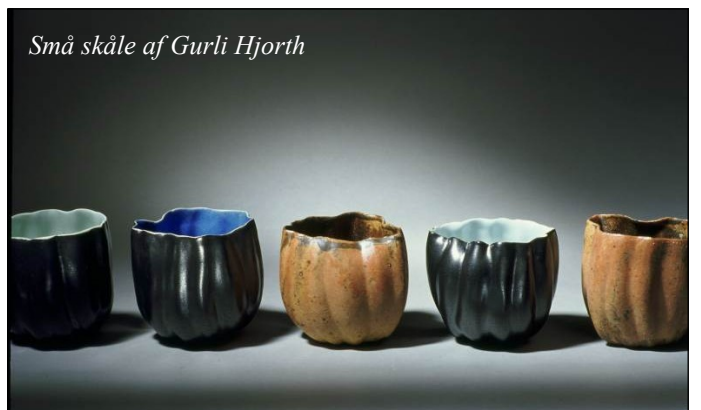
Små skåle af Gurli Hjorth